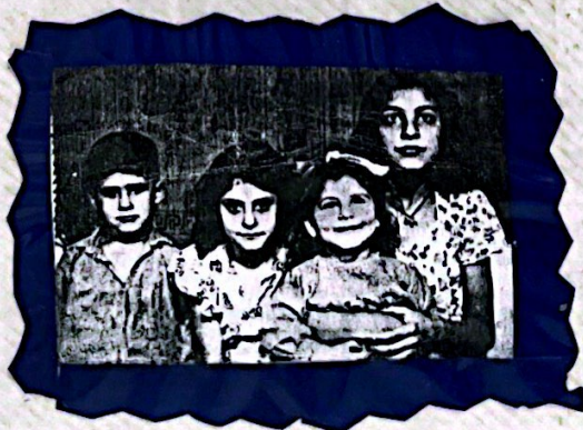
יחנקאש עם אחיותי.

אסיום - האם יש עק דבר מה נוסף מהג'ע? ת- כן ל- הכאב העולם, העולם שאל יעזם, שאל ישכח. נכון, ישנם היום אוסדות אסוימים כאו בור יב חבנים שיכשם שעצמי שמשפחות שבתות עם כאבם, חקוד, ומו כואם, אבל תשוב שאל נעמן ששכות.