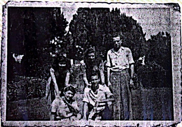
צ'בי עם מספר ידורים וידיות.