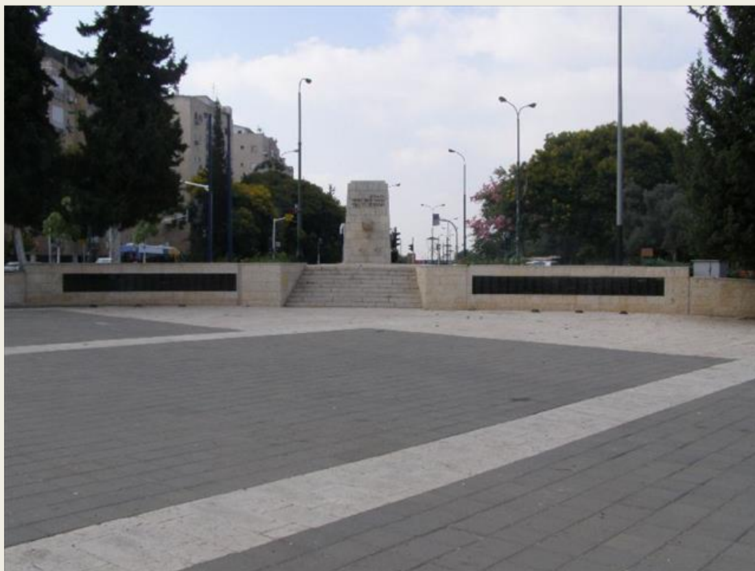
אנדרטה לזכר בני העיר שנפלו במערכות ישראל ראשון לציון