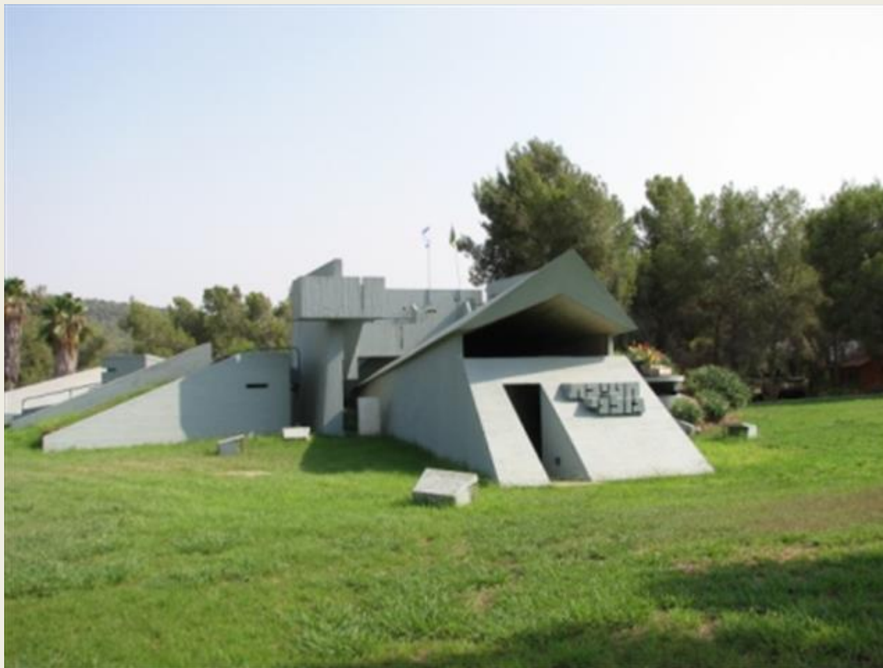
אתר הנצחה ומוזיאון חטיבת גולני צומת גולני