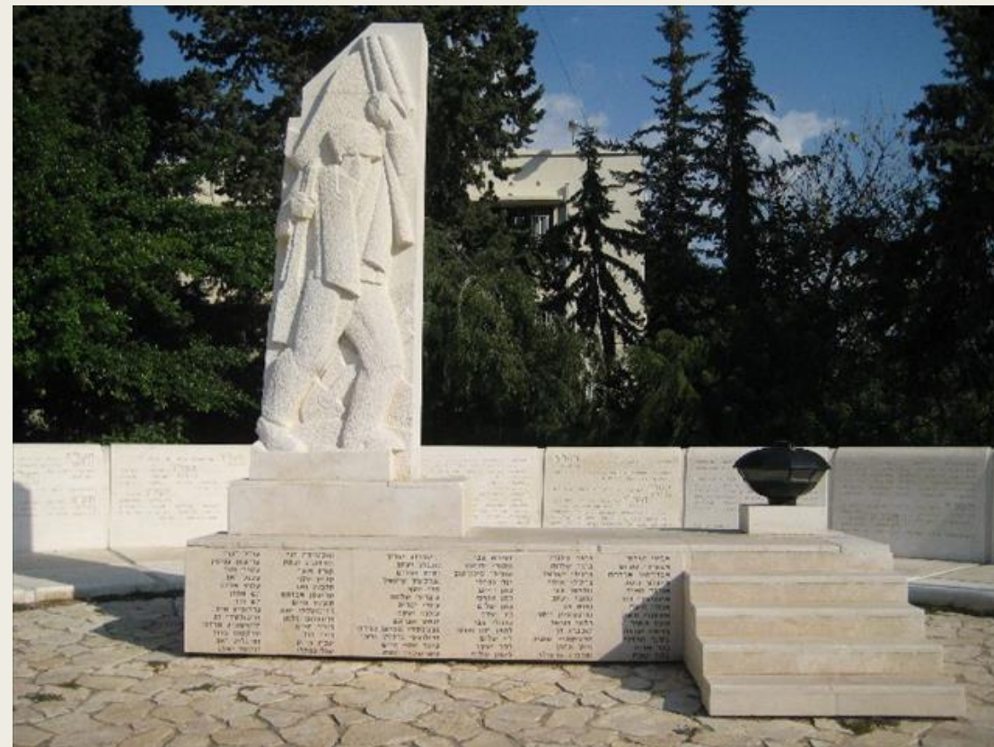
אנדרטה לבני העיר שנפלו במערכות ישראל חולון