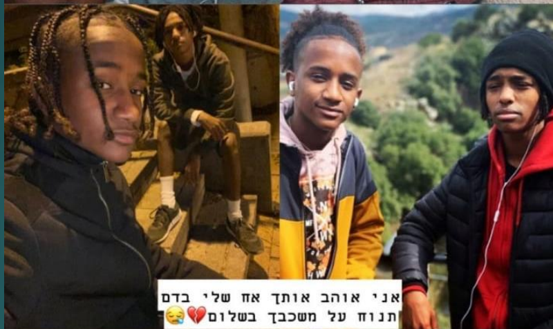
אני אוהב אותך אח שלי בדם תנוח על משכבך בשלום 🙏❤️😭