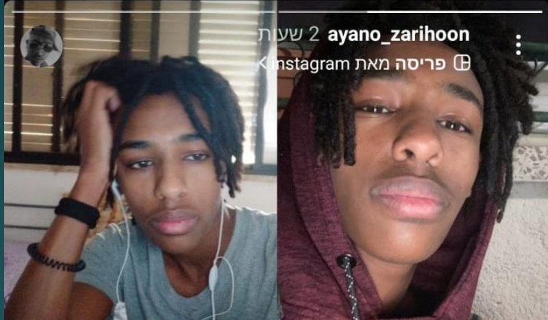
2 שעות ayano_zarihoon פריסה מאת Instagram