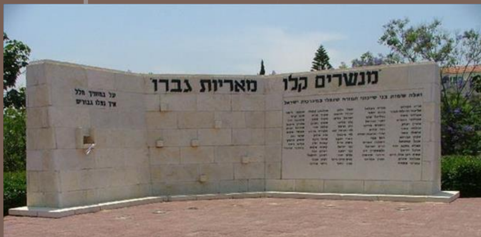
אנדרטה לבני שיכונני המזרח שנפלו במערכות ישראל