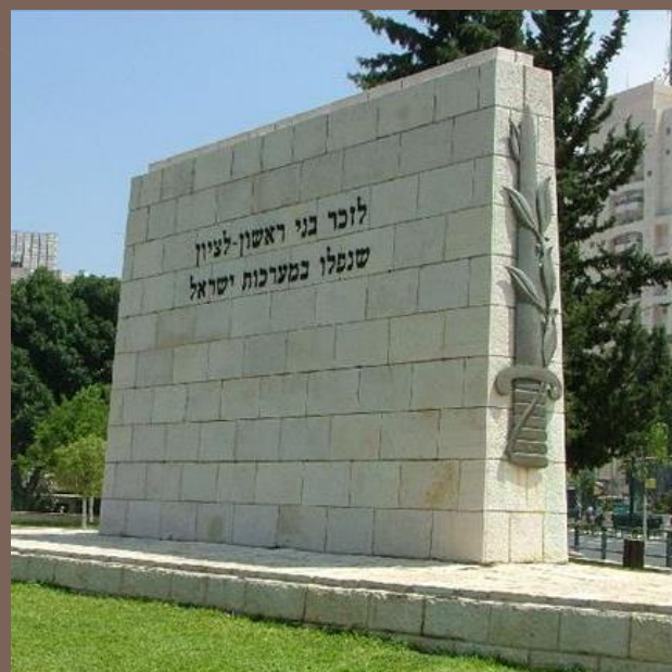
אנדרטה לזכר בני העיר ראשון לציון שנפלו במערכות ישראל