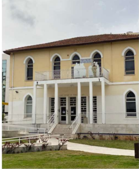
בית יד לבנים, ראשון לציון