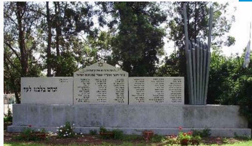
אנדרטה לבוגרי כפר הנוער על שם מוסינזון