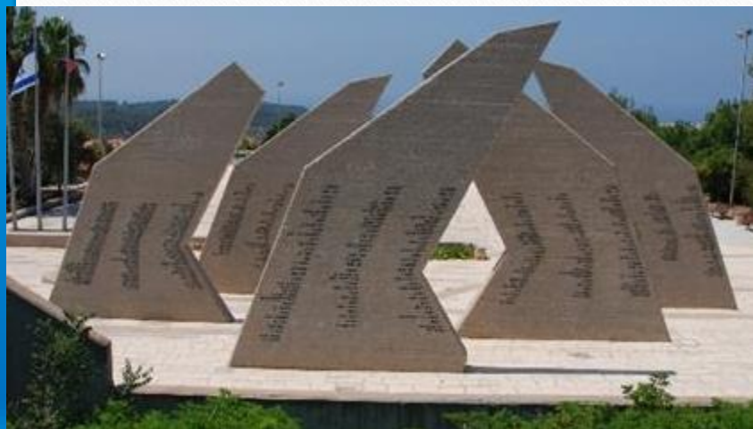
אתר הנצחה לחללי חיל התותחנים זכרון יעקב