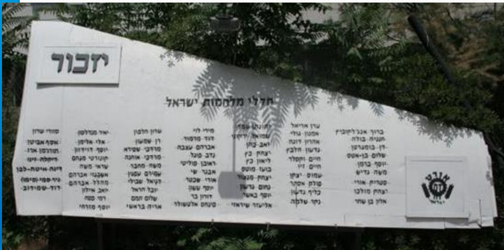
יד לבוגרי אורט הנביאים חללי מערכות ישראל ירושלים