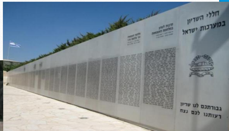
יד לשריון, לטרון