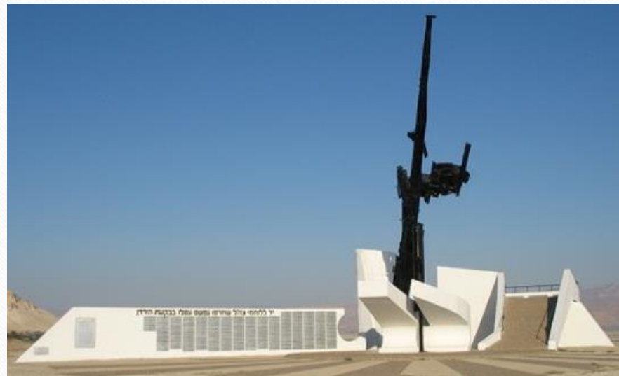
אנדרטת הבקעה כביש הבקעה, פצאל - משואה