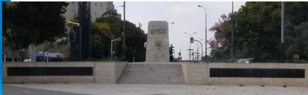
אנדרטה לזכר בני העיר שנפלו במערכות ישראל ראשון לציון