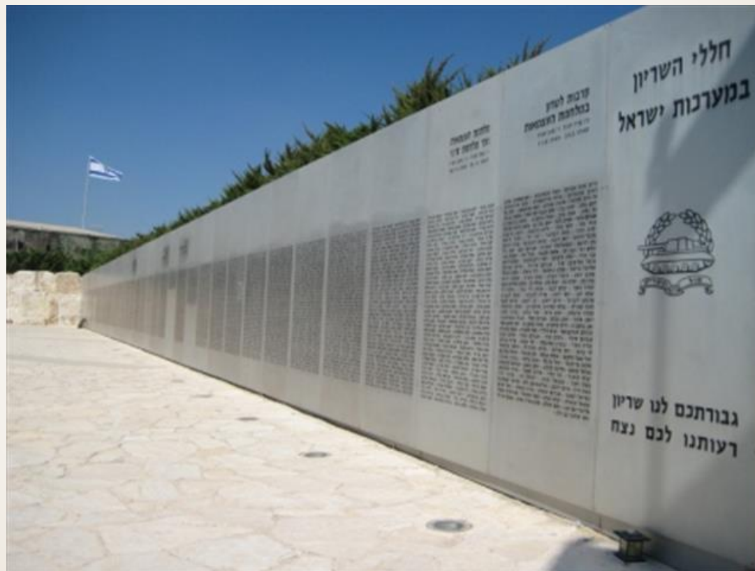
יד לשריון לטרון