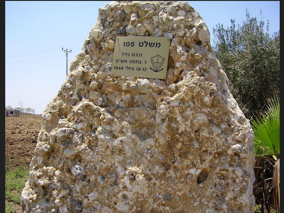
אנדרטת משלט 105 ליד נגבה