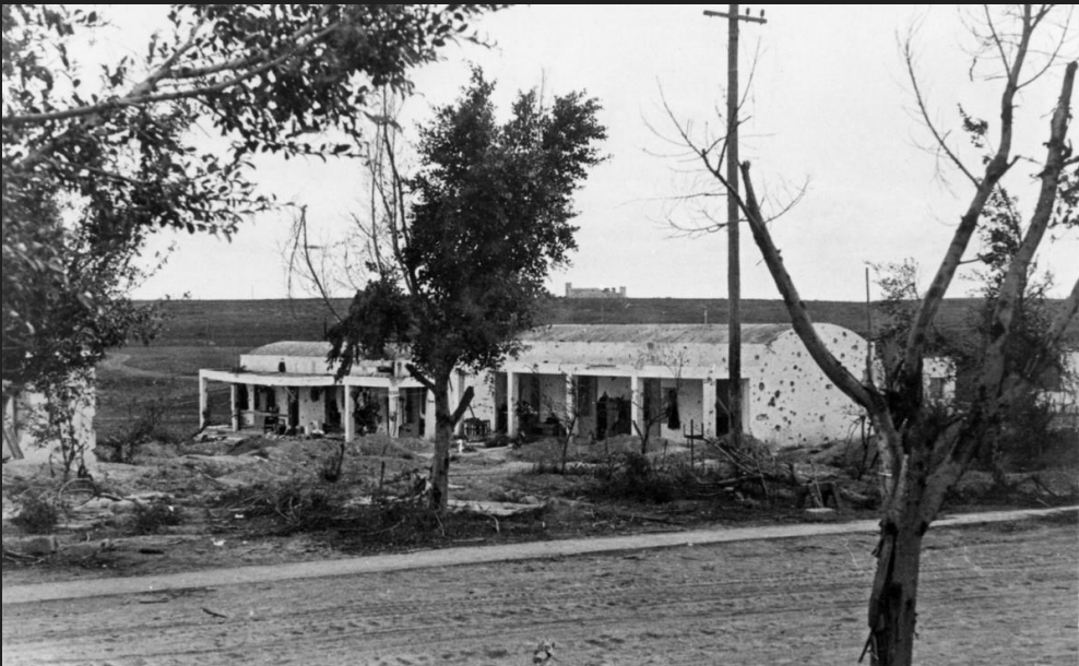
נגבה בתים שהופגזו

כוחות חטיבת הנגב יצאו בלילה שבין ה 8- ל 9- ביולי כדי לכבוש את משטרת עיראק סואידן. הכוחות הגיעו באיחור, וסיימו לחתוך את הגדרות רק כשהאיר השחר, ולכן נאלצו לסגת.