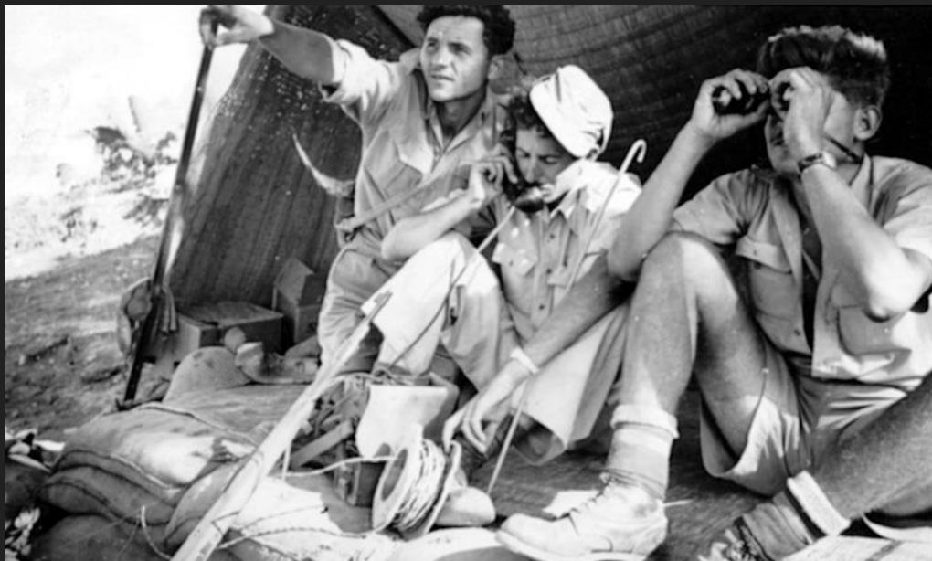
לוחמים בעמדה בנגבה