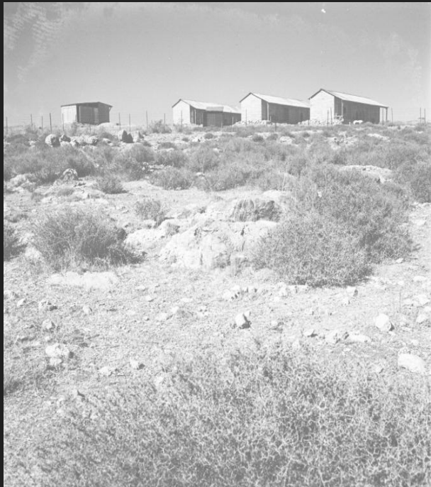
01.11.1946 קיבוץ גלאון

בניסיון נוסף בגזרה ניסו המצרים להתקיף את קיבוץ גלאון אך נהדפו מבצע אנ-פאר לא השיג את מטרתו העיקרית, שכן הדרך לנגב לא נפרצה, אך הוא שיבש את תוכניות המצרים. צה"ל עבר ממגננה להתקפה.