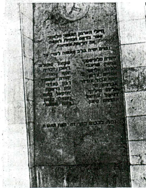
האנדרטה לנופלים במלחה.