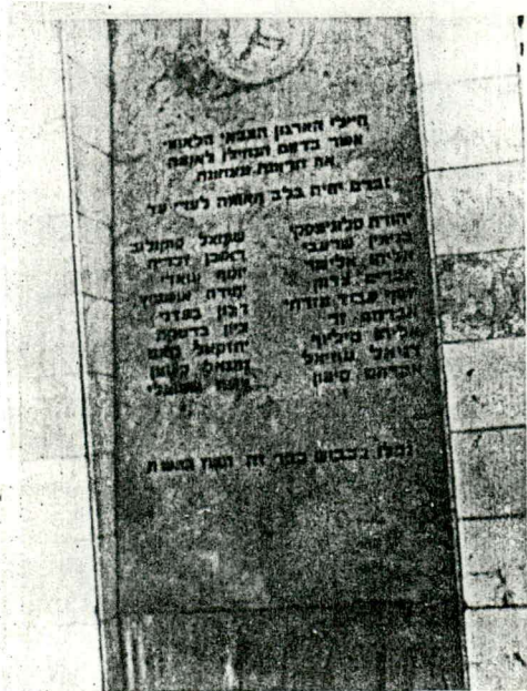
האנדרטה לנופלים במלחה.