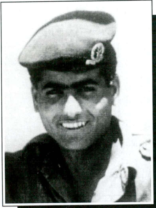
סמ"ר מדר אחיהוד ז"ל בן 29 בנפלו